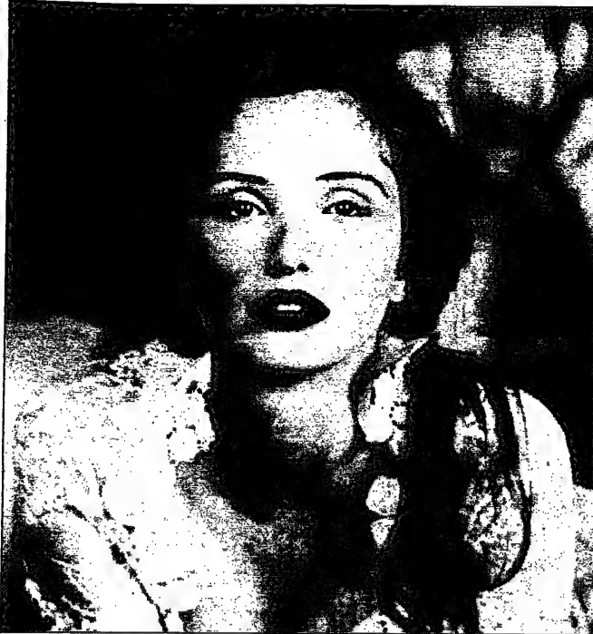
مثلة جولي ديبلبي

جولي ديبلبي مثلة من كبار المخرجين الفرنسيين امثال شروان وكارصن، والتاريخية لكثرتها في الودائع المتعددة مثل جولي، بيبي، وينديت وفرندي. خدمت هذه المثلة مجتمعها في امريكا فوجدت نفسها في الميادين الفرنسية نوما ما، فاصبحت يديها المرفوعة لرفيقاتها البديته. هكذا تحدثت جولي ديبلبي في لقاء جريدة (Le Monde) في باريس من جولة في جوارها. بعد حواله ربع قرن من العمل في الميادين، فقد باتت هذه المثلة من الاعلام يعجبني. لا اقول بانه قديم، بل اني اجد فيه الكثير من الصفات التي تجعله يظل دائما كالمثلة التي كانت في بدايتها. وقد اصبحت جولي ديبلبي من الاعلام التي لا يمكن ان تتركها دون ان تحبها. في حوارنا معها، تحدثت جولي ديبلبي عن بدايتها في العمل في الميادين، وعن تجربتها في امريكا، وعن عودتها الى فرنسا، وعن حياتها الشخصية، وعن افلامها التي اخرجتها، وعن افلامها التي اخرجتها، وعن افلامها التي اخرجتها. جولي ديبلبي هي ابنة فرنسا، وهي ابنة المثلة الفرنسية، وهي ابنة فرنسا، وهي ابنة المثلة الفرنسية، وهي ابنة فرنسا، وهي ابنة المثلة الفرنسية. جولي ديبلبي هي ابنة فرنسا، وهي ابنة المثلة الفرنسية، وهي ابنة فرنسا، وهي ابنة المثلة الفرنسية، وهي ابنة فرنسا، وهي ابنة المثلة الفرنسية.